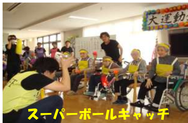
スーパーボールキャッチ