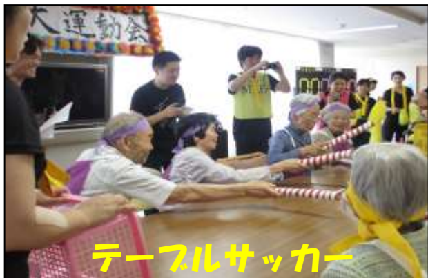
テーブルサッカー