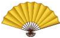
すみれ棟・ひげダンス!!