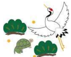
デイケア・東京音頭★炭坑節