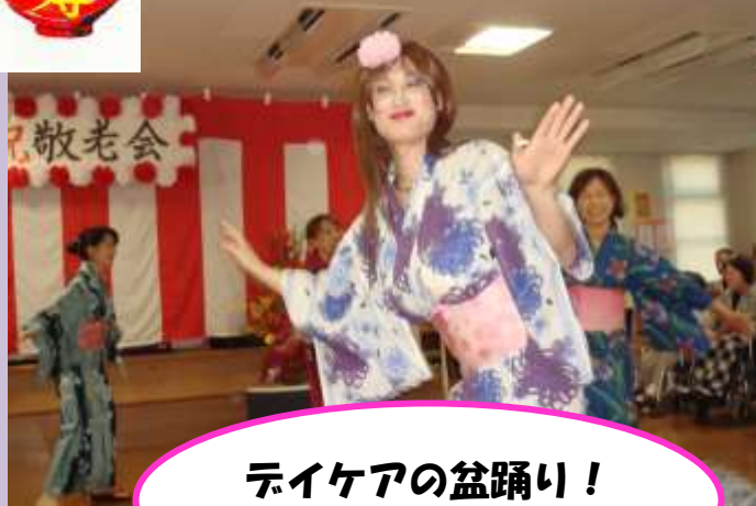
デイケアの盆踊り！ 美しい！？