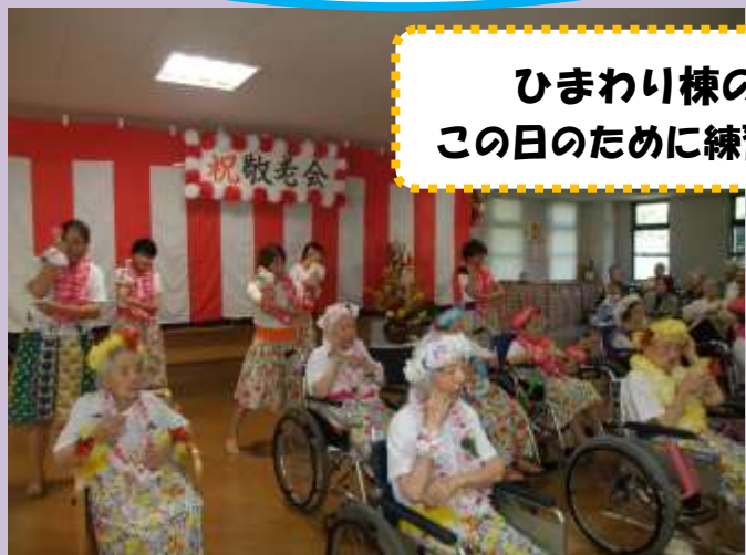
ひまわり棟のフラダンス！ この日のために練習をしてきました！