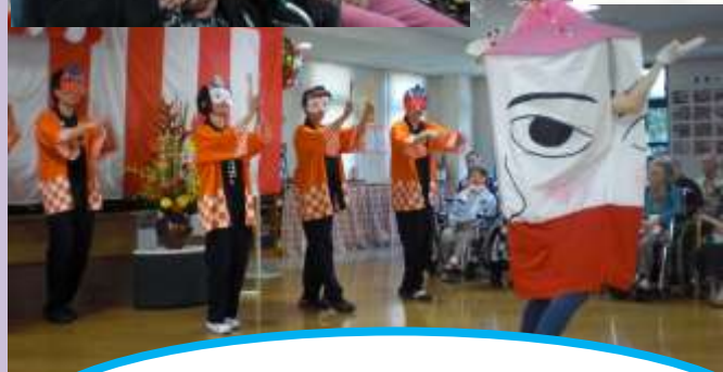
コスモス棟の博多どんたく 博多ぶらぶらも踊りました！