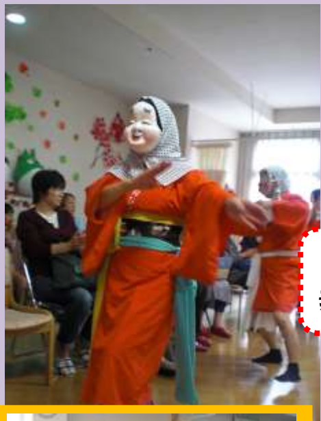
ひょっとこ踊り 素敵な笑顔ですね！